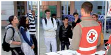
Opération de prévention Sécurité Routière

Le Bureau Information Jeunesse a toujours été un outil important de la politique menée par la municipalité en direction de la jeunesse. Il permet une complémentarité avec d'autres services et une action globale en direction de l'ensemble du public jeune. Le BIJ est une réponse pertinente aux besoins d'accompagnement.