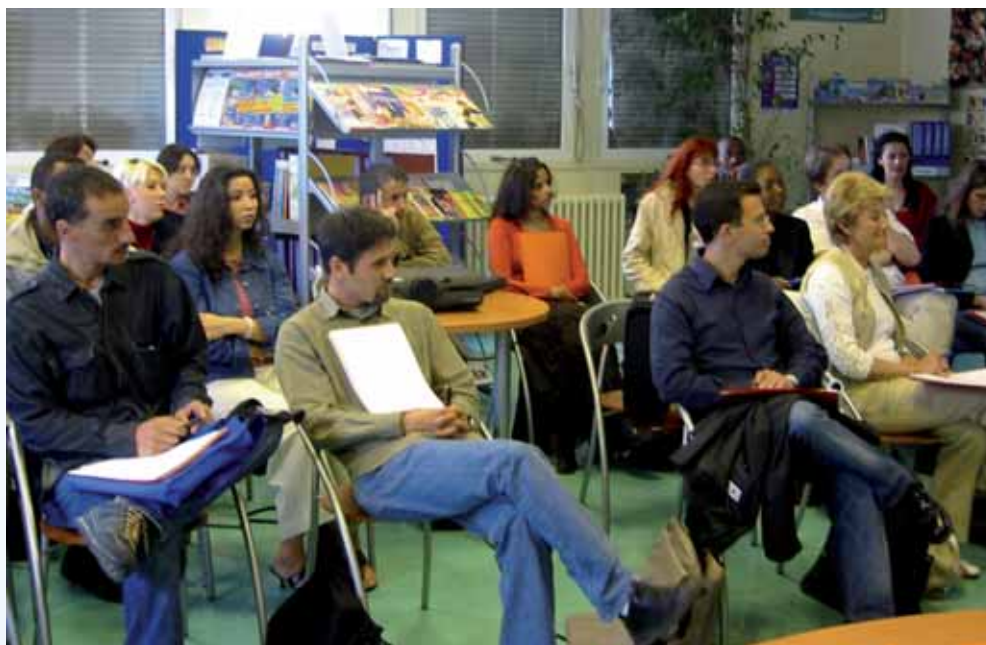
Réunion de Réseau au BIJ de Villeneuve-la-Garenne

Sur la base d'un dossier présentant le projet de la structure sur lequel l'avis de la Direction Départementale concernée est requis, la commission de labellisation composée des référents IJ de chaque département, se prononce.