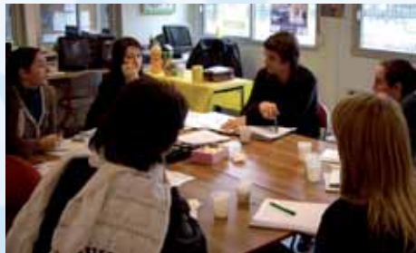
PIJ de Rueil-Malmaison