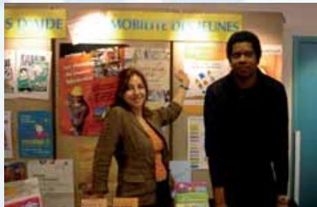
BIJ de Châtillon

Il doit gérer la relation du jeune à l'information, permettre sa compréhension, son appropriation, sa bonne utilisation.