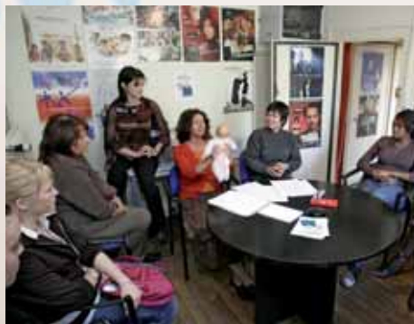
Stage de formation Baby-Sitting