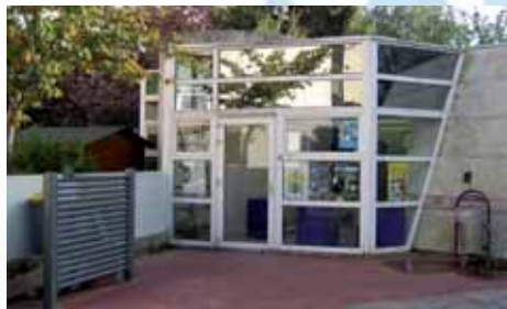
Le nouveau PIJ de la Ville de Meudon

PIJ de Meudon - 69, rue de la République Fabien Ibri - 01 46 26 41 89